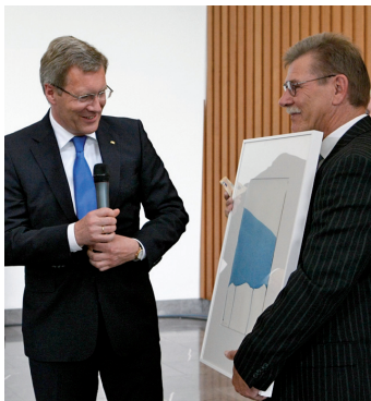
Bundespräsident Christian Wulff hat anlässlich seines Antrittsbesuchs im Saarland die erste Bürgeraktie erhalten